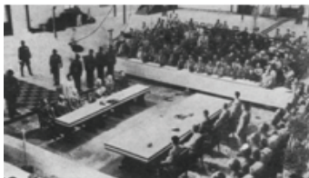
图3 日本在南京递交投降书