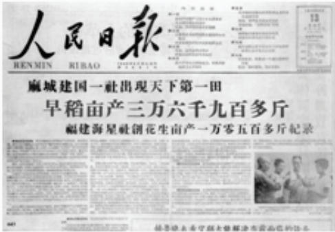
图5 1958年8月15日《人民日报》