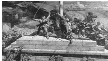
图4 人民解放军占领南京