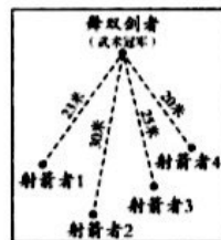
演播室实验示意图